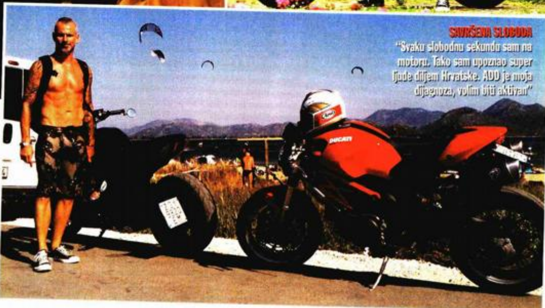
SAVRŠENA SLOBODA "Svaku slobodnu sekundu sam na motoru. Tako sam upoznao super ljude diljem Hrvatske. ADD je moja dijagnoza, volim biti aktivan"

ih usmjeravati, a ne ugnjetavati, ali i učiti da poštuju obitelj, prijateljstva te da shvaćaju da njihovo ponašanje utječe na njihovu okolinu - otkrio je Tomo koji se dosad selio čak 15 puta.