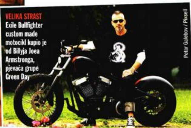
VELIKA STRAST Exile Bullfighter custom made motocikl kupio je od Billyja Joea Armstronga, pjevača grupe Green Day