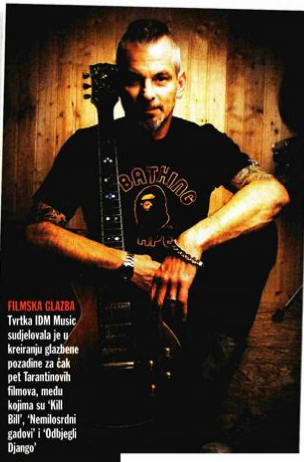
FILMSKA GLAZBA Tvrtka IDM Music sudjelovala je u kreiranju glazbene pozadine za čak pet Tarantinovih filmova, među kojima su 'Kill Bill', 'Nemilosrdni gadovi' i 'Odbjegli Django'